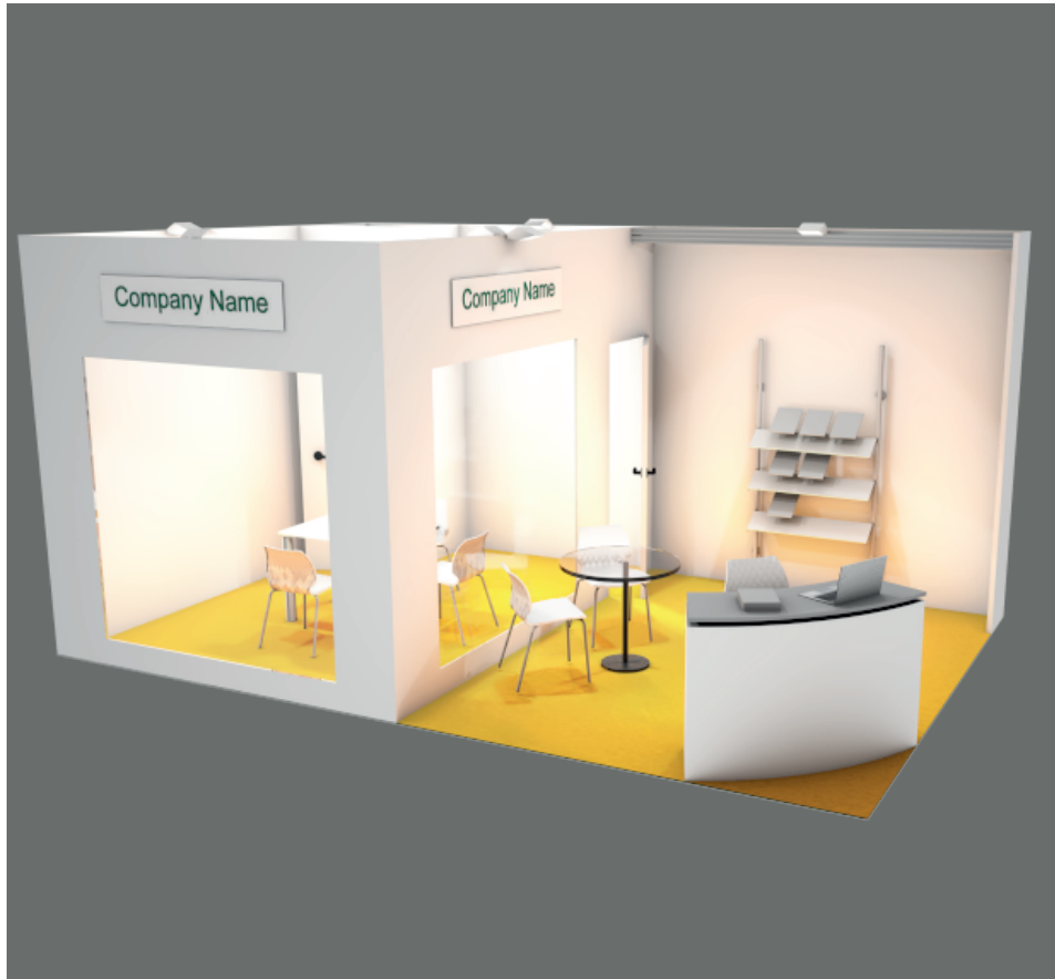
Soluzione 2 lati aperti / Two open sides booth